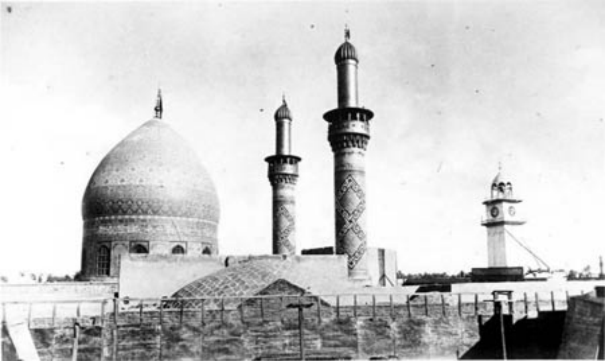
THE SHRINE OF IMAM ABBAS. KARBALA, IRAQ